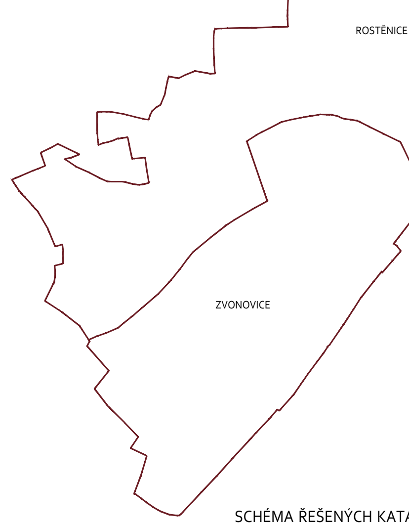
SCHEMA ŘEŠENÝCH KATASTRÁLNÍCH ÚZEMÍ

ZASTAVĚNÉ ÚZEMÍ ORGÁNU BYLO TOUTO ZMĚNOU AKTUALIZOVÁNO V SOULADU S LEGISLATIVOU PLATNOU K 31. 12. 2023. ZASTAVĚNÉ ÚZEMÍ ORGÁNU BYLO TOUTO ZMĚNOU AKTUALIZOVÁNO V SOULADU S LEGISLATIVOU PLATNOU K 31. 12. 2023.